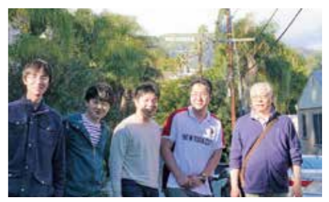
研修先からハリウッドまで約2キロ