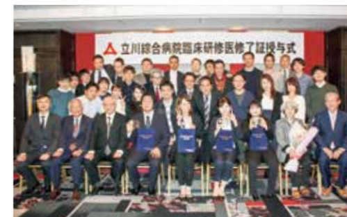
臨床研修医修了証授与式