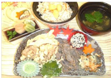
【秋の松茸彩り御膳普通食】