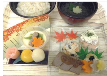
【秋の松茸彩り御膳ムース食】

9月14日(火) 秋のレクリエーション献立を提供いたしました。秋の味覚満載の彩り御膳「栗ときのこの炊き込みご飯、松茸のお澄まし、山古志牛焼肉、秋野菜の天婦羅盛り合わせ、銀鮭ときのこのクリームチーズ焼き、ひじきの白和え、松茸茶わん蒸し、葡萄とパンナコッタの鉢植え風デザート」は大変好評でした。今月も秋の行楽弁当の提供を予定しております。楽しみにお待ちしております。