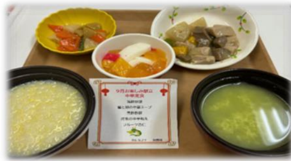
【中華ランチムース食】

栄養科特製の本格的な中華ランチは利用者の皆様に大変好評でした。今月もイベント献立の提供を予定しております。楽しみにお待ちしております。