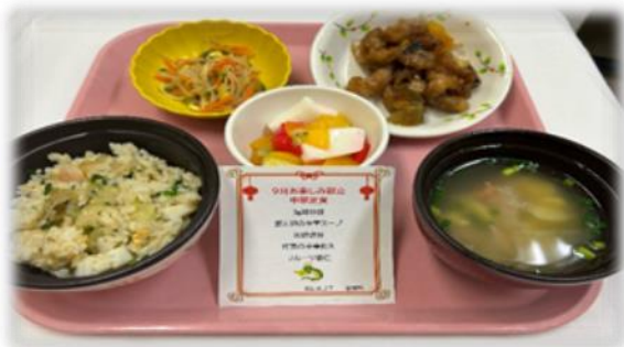
【中華ランチ普通食】